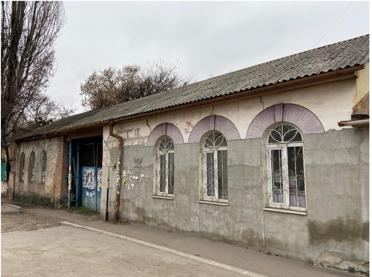
Фото 1. Объект культурного наследия регионального значения «Лечебница «Приют Святой Ольги»», 1872 г. Общий вид.

Материалы фотофиксации объекта культурного наследия регионального значения «Лечебница «Приют Святой Ольги»», 1872 г., расположенного по адресу: Ставропольский край, г. Пятигорск, ул. Дзержинского, 78 (литеры Д, Д1)