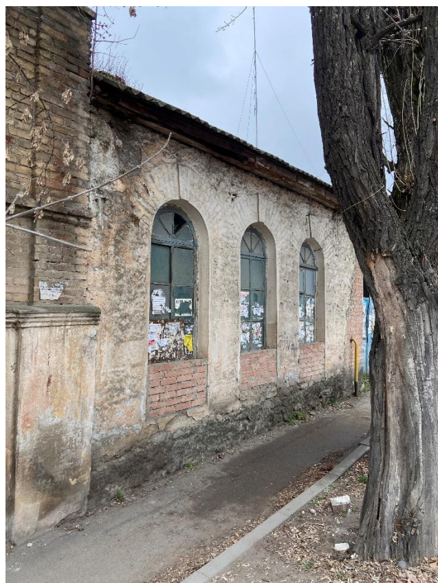
Фото 2-5. Объект культурного наследия регионального значения «Лечебница «Приют Святой Ольги»», 1872 г. Фрагменты фасада.